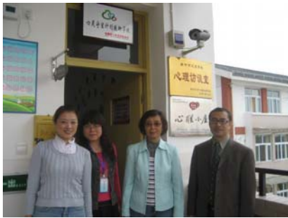
1+1 Heart to Heart Classroom 九龙学校的心理咨询室-心联小屋