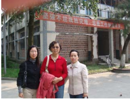
Shichuan Technology College Administration offices 学校行政办公室镶嵌在危楼楼架中