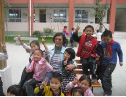
kids playing during the break 课间休息中的学生们