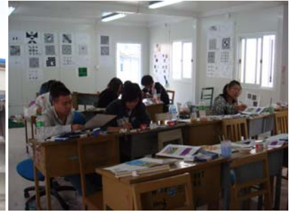
Students are in the temporary classroom 学生在临时板房教室中上课