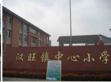
New Hanwan school 新建的汉旺镇中心校能容纳 1000 学生