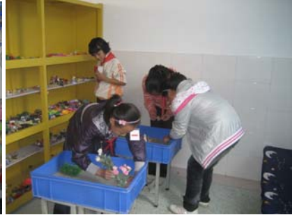
Playing games in 1+1 classroom 孩子们在心联小屋中作游戏