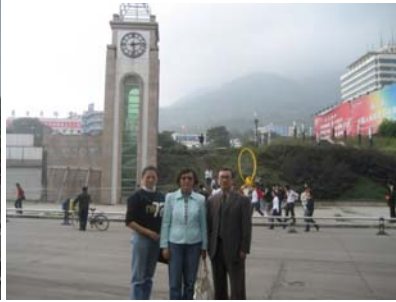
2:28pm, earthquake starts on 5.12 汉旺镇东汽广场时钟定格在 2 点 28 分