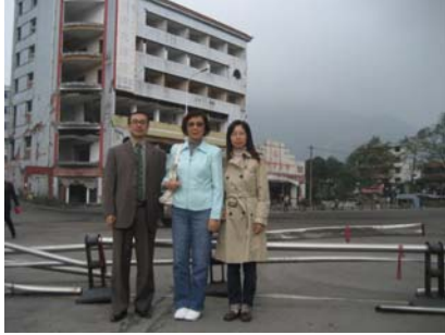
A damaged Building in Hanwan 绵竹市汉旺镇-5.12 地震重灾区