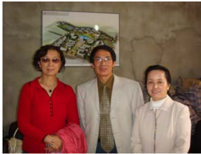
School blue print and principal 校长对明年搬入新校充满信心