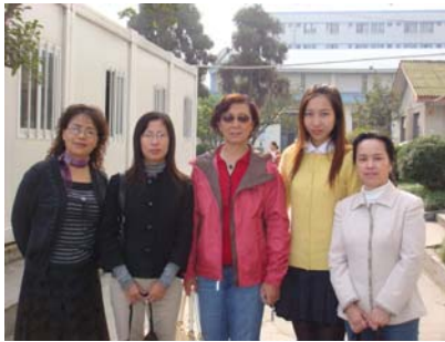
With 1+1 trained teachers 四川工商技术职业学校的老师