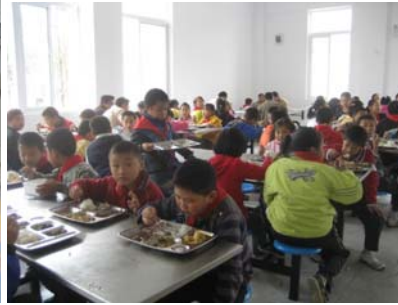
student at Lunch in new school 与学生们共进午餐