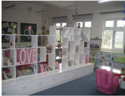
1+1 Heart to Heart Classroom 心联小屋中充满了爱