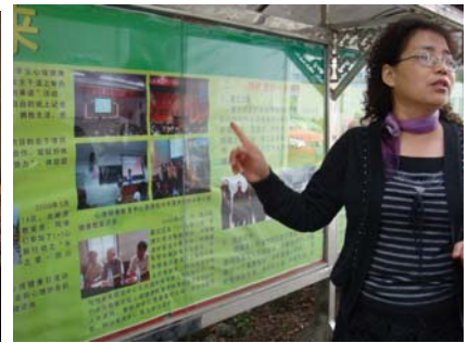
Successful stories of 1+1 activities 1+1 心联活动丰富多彩，成效显著