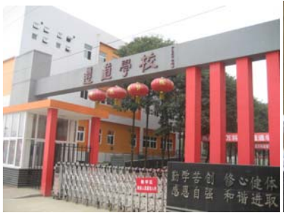
Another New school 由万科资助建立的遵道学校