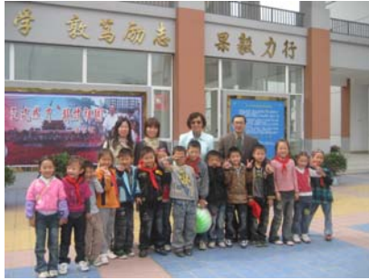
In front of the new school building 与汉旺镇中心校师生们在新校舍前合影