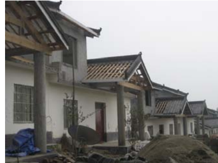
New houses will be completed soon 新建的民居快要完工了。