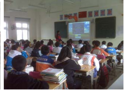
Study in the new Class room 学生们崭新的教室里上课