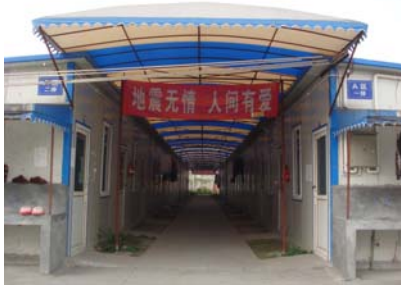
Students live in portable houses in the school 板房区的学生宿舍